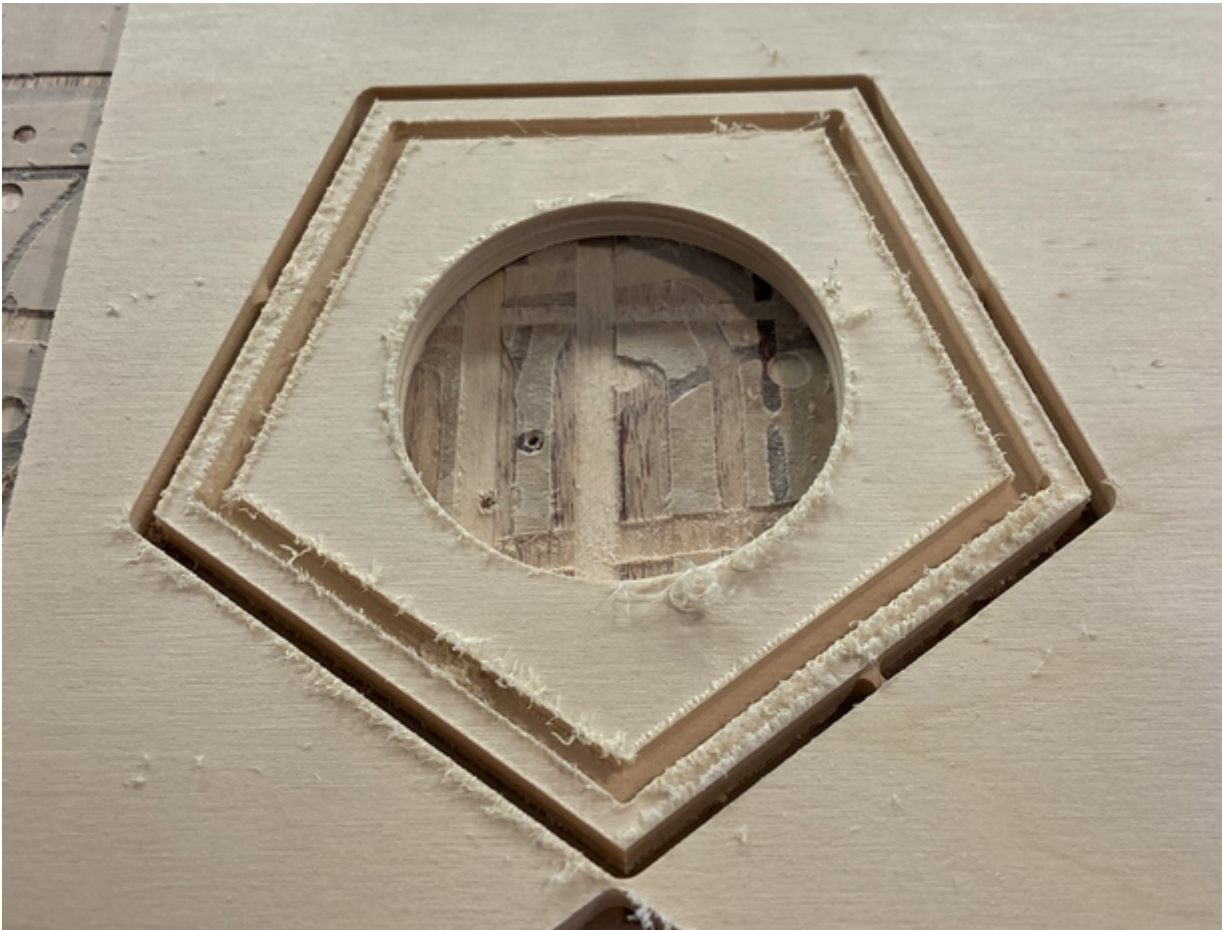
Das fertige Teil